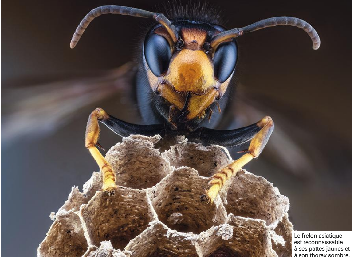
Le frelon asiatique est reconnaissable à ses pattes jaunes et à son thorax sombre.

moins de personnes allergiques que de personnes ayant subi des attaques massives. Si les guêpes ne sont pas particulièrement agressives lorsqu'elles volent de manière isolée, il n'en est pas de même à proximité du nid : à moins de cinq mètres d'un nid de guêpes ou de frelons, ses occupants se sentant menacés peuvent sortir tous en bloc et attaquer ! Attention alors : une trentaine de piqûres de guêpes ou une dizaine de piqûres de frelons injectent suffisamment de venin pour tuer un adulte.